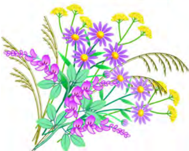
栗原 セツ子様 (Kurihara Setsuko)