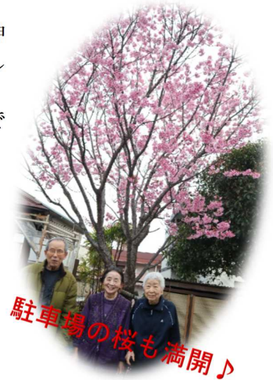
駐車場の桜も満開♪