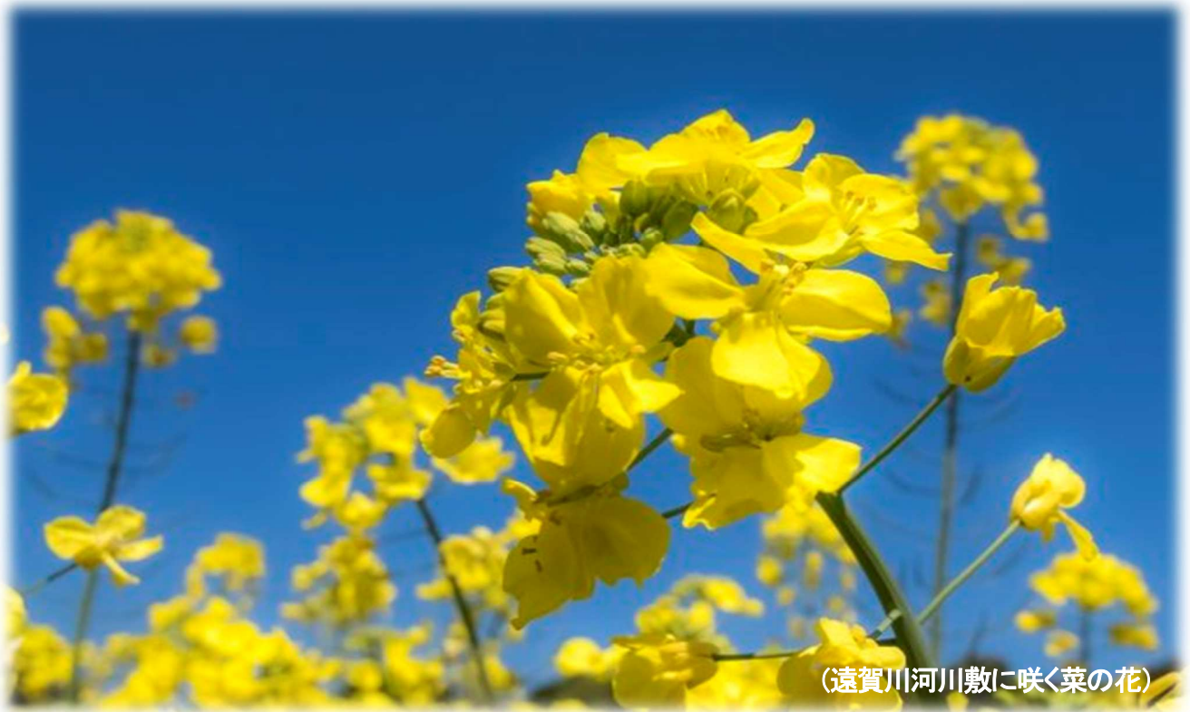
(遠賀川河川敷に咲く菜の花)

E - mail info@kaorukai.jp URL http://www.kaorukai.jp